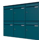
Монтирани към стената