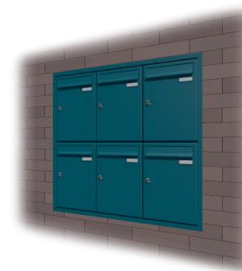
Вградени в стената