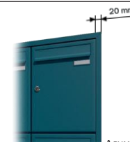
Алуминиева рамка за мазилка