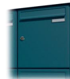
Облицовка от стоманена ламарина